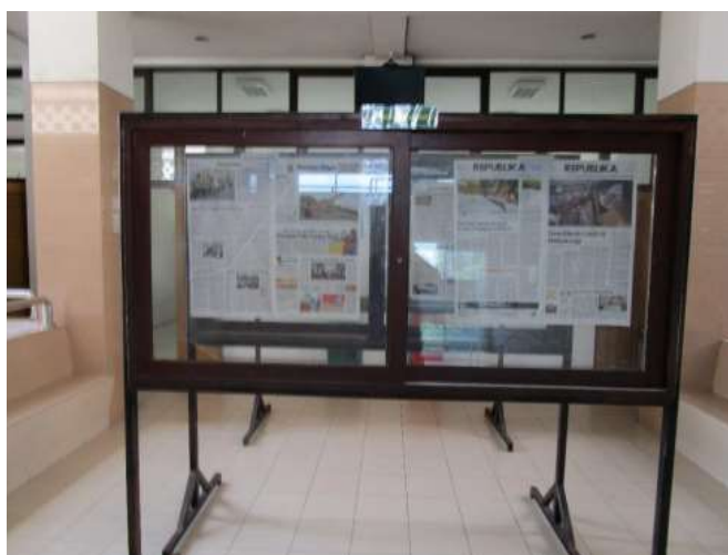
Gambar 6. Papan surat kabar yang diletakkan didalam sekolah

Keempat , terdapat surat kabar harian yang dipajang di sekolah maupun di asrama-asrama yang mendukung penyebaran sumber informasi dan juga dapat meningkatkan motivasi dan minat membaca santri.