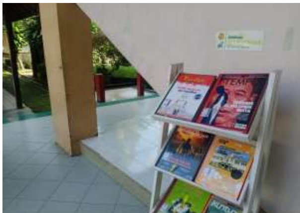
Gambar 4. Rak buku dari program PoLi

Kedua , yaitu program PoLi (Pojok Literasi) program ini diadakan oleh perpustakaan untuk dapat meningkatkan motivasi dan minat baca santri dengan cara mereka bisa mengakses koleksi yang disediakan di pojok-pojok lingkungan sekolah tanpa harus datang ke perpustakaan.