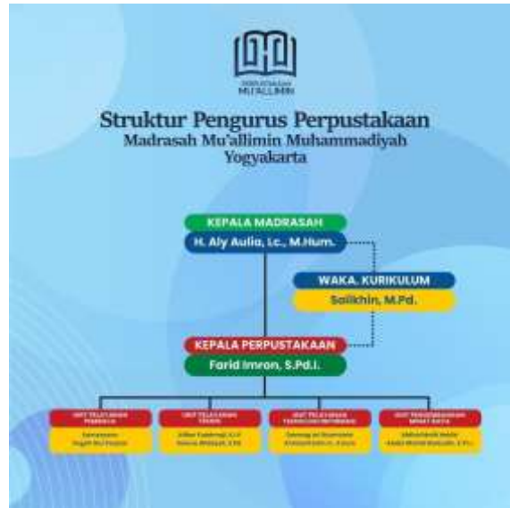
Gambar 2. Struktur anggota perpustakaan Mu'allimin