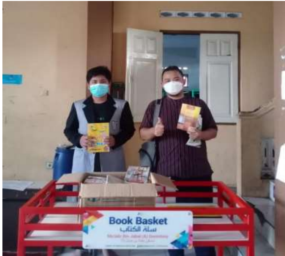
Gambar 5. Ranjang buku PUSTAMA di salah satu asrama

Seperti yang disampaikan oleh AM dalam wawancara tanggal 31 Januari 2022.