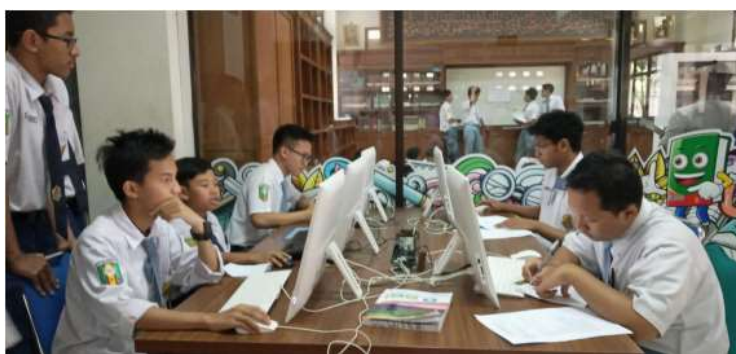
Gambar 3. Fasilitas komputer untuk mendukung pembelajaran

Pertama , ada fasilitas komputer dengan jaringan internet yang menunjang informasi santri selama masa sekolah, fasilitas komputer sendiri memiliki daya tarik bagi santri untuk mengunjungi perpustakaan karena santri-santri ini dapat mengakses situs-situs pembelajaran.